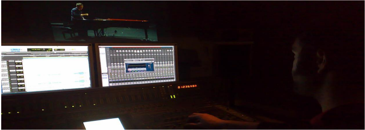
Le studio du CIRM